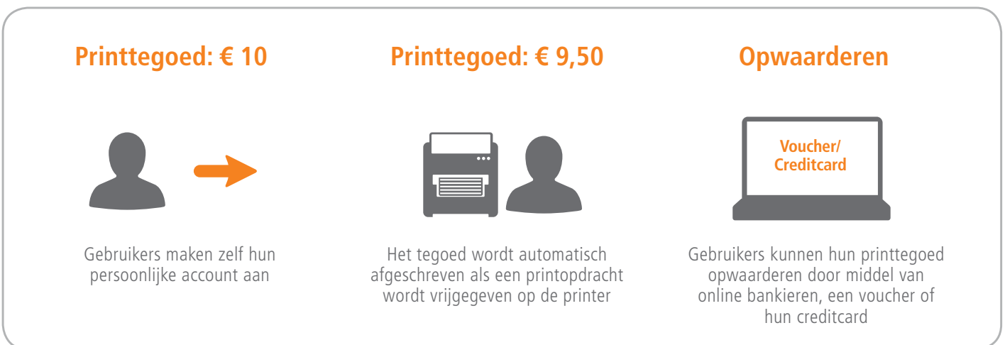
Afbeelding 2: Gebruikers kunnen met Ricoh myPrint via hun printtegoed gebruikmaken van alle printfaciliteiten.

Door de controle en het toezicht op de afdrukgeving, maakt u gebruikers bewust van hun printgedrag. Zo heeft u met minimale inspanning de controle en het overzicht, terwijl u anderzijds geld bespaart.